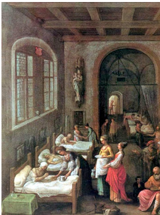
Santa Isabel d'Hungria atenent els malats

ISABEL DISPOSA DELS SUBTIDITS COM SI FÓSSIM AMOS