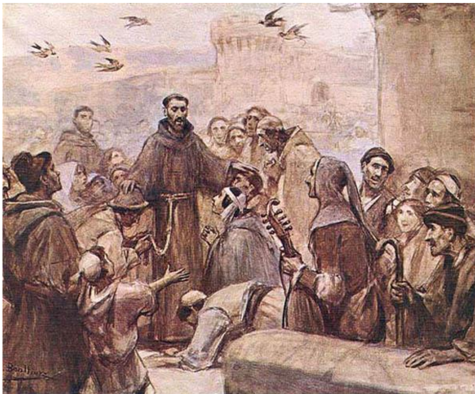
J. Benlliure: El pueblo acude a Francisco