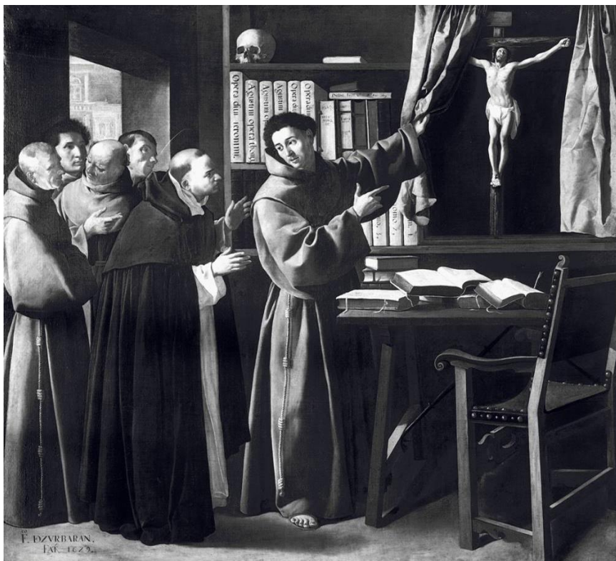
Sant Bonaventura ensenya el crucifix a Sant Tomàs d'Aquino - Zurbarán.

Sovint se'l representa amb el vestit del seu Orde, però amb el barret cardenalí.