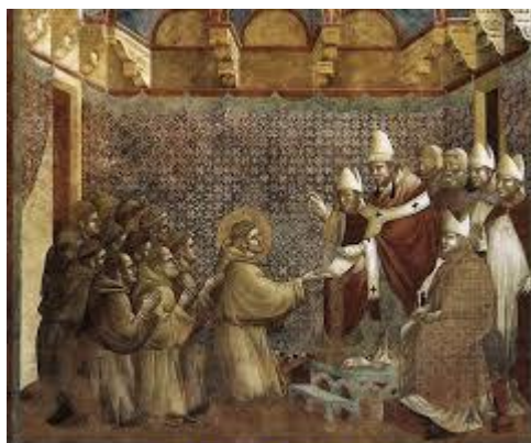
Giotto: Confirmación de la Regla