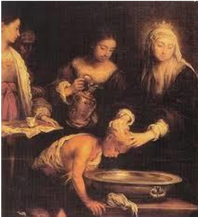
Bartolomé Esteban Murillo, Santa Isabel d'Hungria curant tiñosos