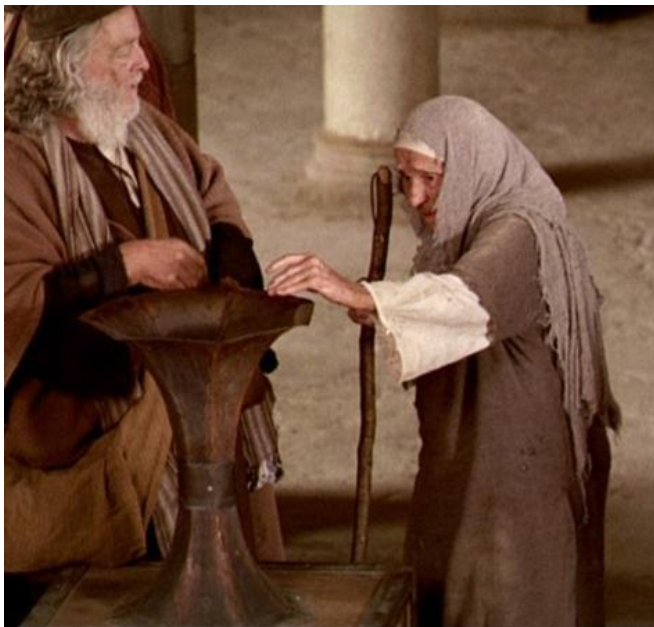
L'ofrena de la viuda pobre