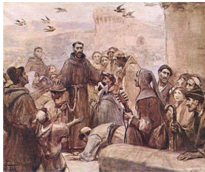
J. Benlliure: El pueblo acude a Francisco