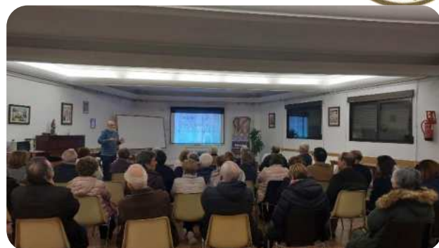
“San Luis, rey de Francia” Rafael M OFS