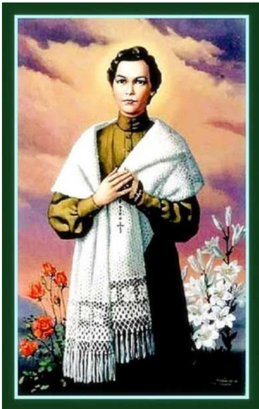
Beata Ángela Salawa

Angela murió el 12 de Marzo de 1922 en Cracovia. Beatificada por el Papa Juan Pablo II el 13 de agosto de 1991. La Orden Tercera la recuerda el 13 de marzo.