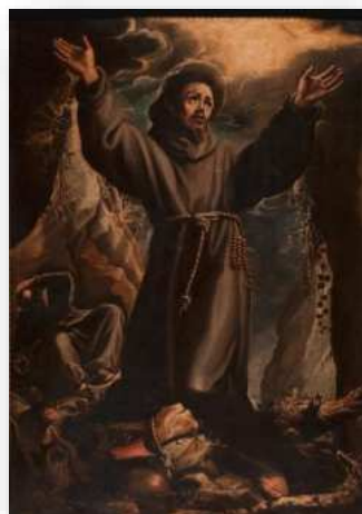
San Francisco recibiendo los estigmas 1605 Orazio Borgianni

Entramos dentro de nosotros mismos, nos detenemos en recogimiento, en oración, y por último miramos hacia arriba en adoración y alabanza.