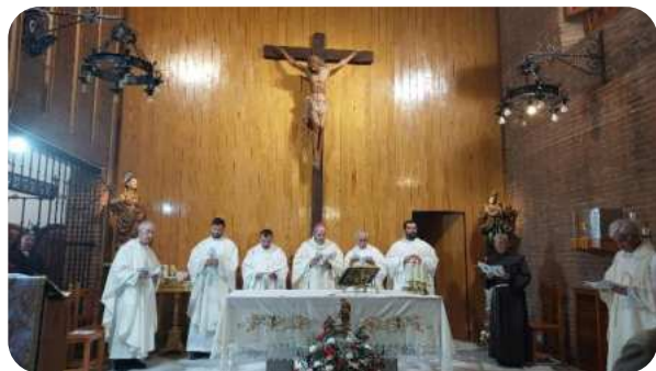
Novena y Eucaristía San Diego de Alcalá Convento hermanas Clarisas de San Diego