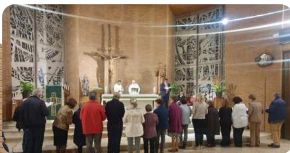
Renovación compromiso evanaélico