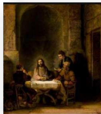
"La Cena de Emaús', 1648. Rembrandt París, Museo del Louvre

Y siempre sin mirar atrás para no desviarnos de la línea recta (como dice el Evangelio de Lucas 9,62..." El hombre que pone la mano en el arado y luego mira atrás ...) )