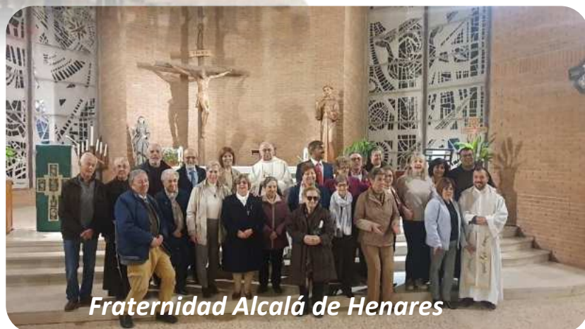
Fraternidad Alcalá de Henares