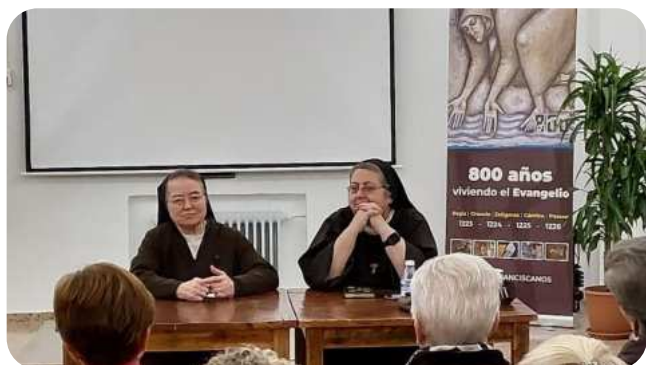
“Vivir toda una vida como hermana pobre” Hermanas Clarisas San Juan de la Penitencia OFC